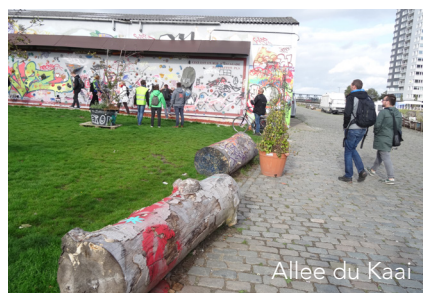
Allee du Kaai