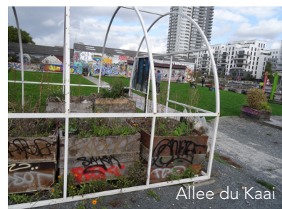
Allee du Kaai