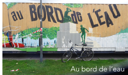
Au bord de l'eau

Op lokaal vlak vallen er echter nog gaten en zijn de noden groot. Omdat de Brusselse bestuurlijke context heel lastig is en maar al te vaak tot immobilisme leidt, nemen sommige burgers het heft dan maar in eigen handen. Au bord de l'eau , Parckfarm en AlleeduKaai zijn initiatieven waarin gemotiveerde mensen ruimte creëren voor - soms maatschappelijk kwetsbare - kinderen en jongeren. Het gaat meestal om tijdelijke projecten, maar ze kunnen een plek gedurende enkele jaren veel betekenis geven. Sommige van deze initiatieven worden ondersteund door Leefmilieu Brussel die veel oog heeft voor de sociale dimensie van groenplanning.